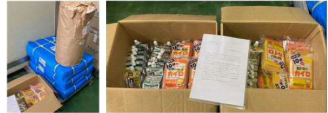
▲生協くまもと様からカイロ、ゼリー飲料、ブルーシート