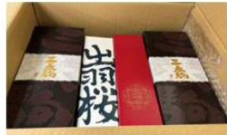
▲みやぎ生協様から 山形や福島の地酒、ワイン