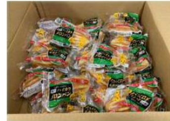
▲コープこうべ様から ハイカラメロンパン