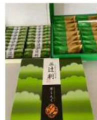
▲京都生協様から 辻利のお菓子