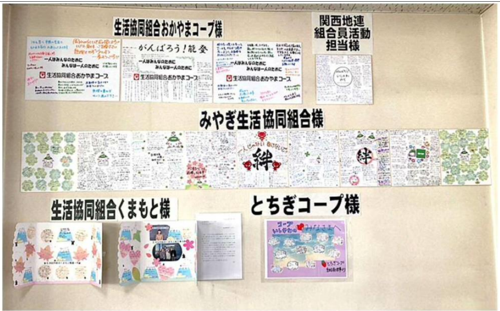
のとセンターに掲示されている全国の生協からいただいた応援メッセージ

「復興支援ニュース」NO.6でみやぎ生協からの応援色紙をご紹介しましたが、その他の生協からもメッセージをいただいています。