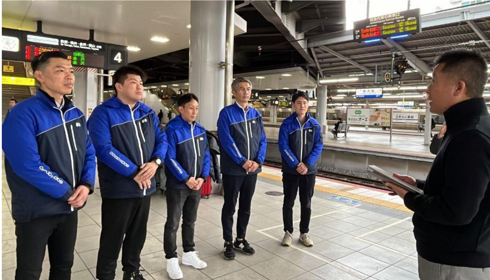
新大阪駅から特急電車で金沢に向かう

コープこうべは、1月14日から被災地の生協「コープいしかわ」に全国の生協の仲間と共に、毎週職員を派遣しています。配達の応援、物流センターでの仕分け、安否確認などに就いています。