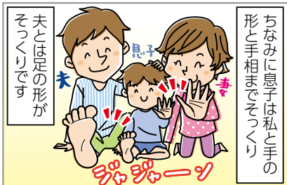
遺伝ってコワイ…(笑)