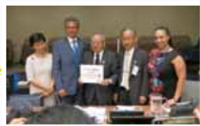
▲国連に署名用紙を提出