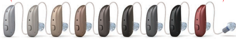
スパーク シャンパン ゴールド ブロンズ チャコール エスプレッソ セビア グレー ディープ ブラック リサウンド レッド シルバー