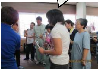
トーンチャイム体験の様子

※お伝えいただいた個人情報については生協の組合員活動のご案内や京都生協で取り扱う商品・サービスのご案内のために利用させていただく場合があります。無断で利用目的以外に使用したり、第三者に提供することはございません。