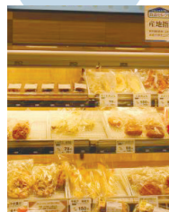
▲パケットレーから袋へ