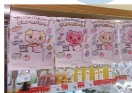
▲お買い物袋持参を呼びかけるぬり絵