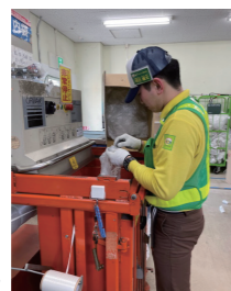
▲ハートコープきょうとでの内袋リサイクルの様子

ほかにも、カタログ類(宅配)、卵パック・紙パック(宅配・店舗)、食品トレー・ペットボトル(店舗)のリサイクルも行っています。