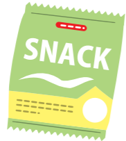
スナック菓子の袋