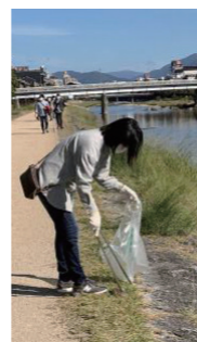
▲鴨川クリーン作戦